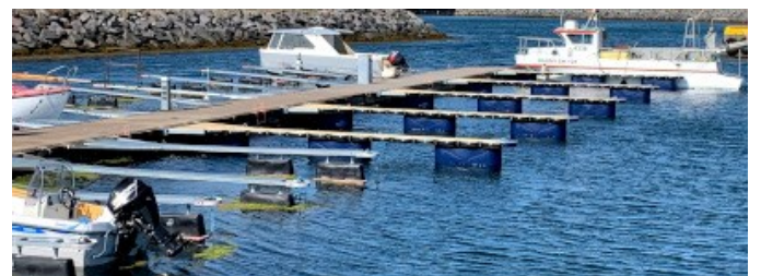
Endurnýjun fingra í Kópavogshöfn (2019) VIKING 0.6 x 8m—3 x 400ltr. Flot 70mm PARMA fenderlistar.

Nýr PARMA 80mm í 2 litum: gulur og koks-grár